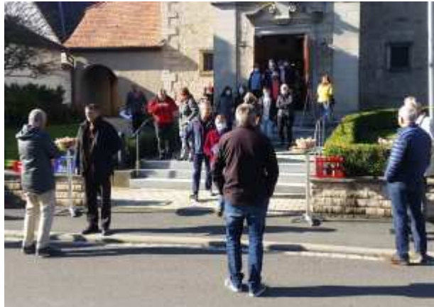
Nach dem Gottesdienst gab es noch ein Beisammensein vor der Marienkirche.