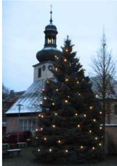
Der Weihnachtsbaum 2020 auf dem Aschbacher Dorfplatz vor der St.-Laurentius-Kirche.

Zeit zur Besinnung – das bieten kleine Andachten in der Adventszeit, mit Musik, Liedern, Texten und Stille. Immer mitwochs vom 1. bis 22. Dezember, 18:30 Uhr in St. Laurentius, Aschbach.