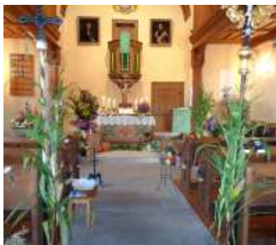
Die Hohner Kirche St. Gallus hatte sich an Erntedank ebenfalls herausgeputzt und präsentierte die Erntegaben am Altar.