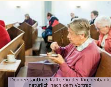
DonnerstagUm3-Kaffee in der Kirchenbank, natürlich nach dem Vortrag

In einer anderen persönlichen Anekdote erzählte Herr Jeschke wie schwer es war, als privater Hausbesitzer ein altes Haus zu sanieren. Es bedurfte viel Geduld, Zeit und auch Schmiergeld, Baustoffe zu sammeln und einzutauschen und