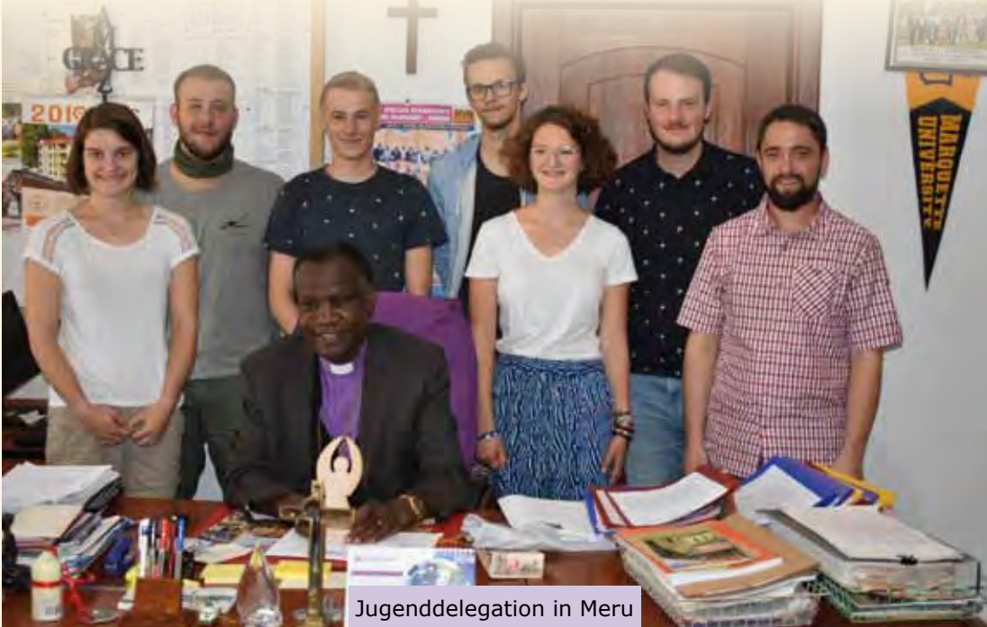
Jugenddelegation in Meru